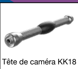
Tête de caméra KK18